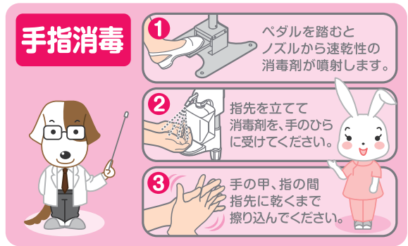
手指消毒用パネル