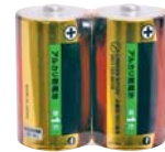
単一アルカリ乾電池(2本組)