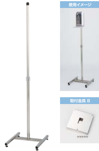
ディスペンサー用マルチスタンド